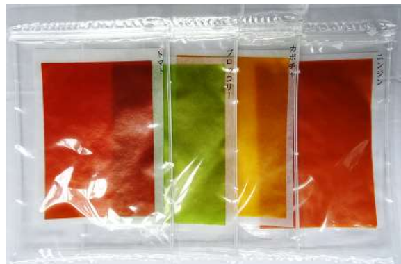
左からトマト ブロッコリー カボチャ ニンジン